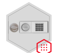
Elektronisches Kombinationsschloss B 30 (Ausser Art. 402000.00 und 402001.00)