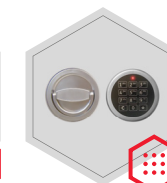
Elektronisches Kombinationsschloss Solar Business