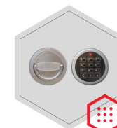
Elektronisches Kombinationsschloss Solar Basic