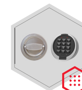
Elektronisches Kombinationsschloss Primor 3000 level 15