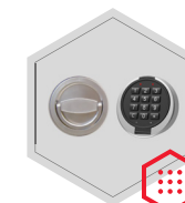
Elektronisches Kombinationsschloss Primor 3000 level 5